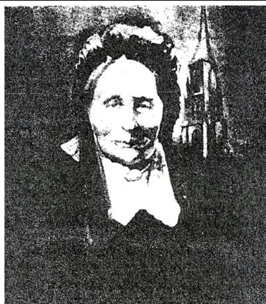
Freule J.J.A.E.C.S. baronesse van Dorth tot Medler naar een schilderij van de Maastrichtse schilder H. Levigne

Nu bood een zekere Herman Franckenmeulen hem een huisje aan, dat hij daarna nog liet vergroten. De pastoor mocht het bewonen zonder huur te betalen. De eerste pastorie stond aan de Bergkappeweg, zo genoemd naar een daar gelegen boerderij, die nu verplaatst is. Hier verhief zich in een drassige wildernis een droog stuk grond, dat als landingsplaats of broedgebied van kraanvogels